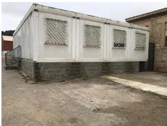
Mòdul actual escola (any 2003)

Ampliació escola Sagrat Cor de Solivella amb un pressupost de 267.320 €, la redacció del projecte es va començar el mes de juny de 2020 així com el estudi geotècnic i el topogràfic. Aquesta obra està finançada per el Pla d'Obres i Serveis (Governació), Pla d'Acció Municipal (Diputació de Tarragona), Departament d'Ensenyament i el propi Ajuntament.